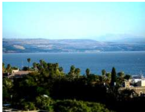
Udsigt fra Tiberias over søen

----- Tiberiasmessen er fra: FRED OG ALT GODT, Liturgier og nadverfejring. Udgivet af Det økumeniske Center, Kløvermarksvej 4, 8200 Århus N (1986).