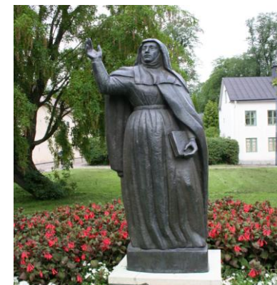
Birgittaforeningen i Mariager