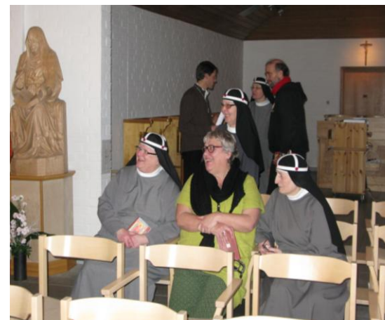
Billedet er fra Birgittasøstrenes kirke.

Søndag formiddag vil der være mulighed for at deltage i en katolsk messe eller svenska kyrkans messe, inden afrejse mod Gøteborg/ København.