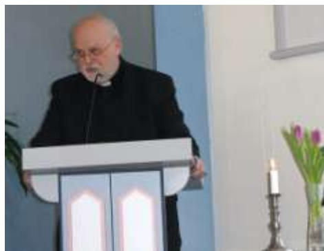
Biskop Anders Arborelius