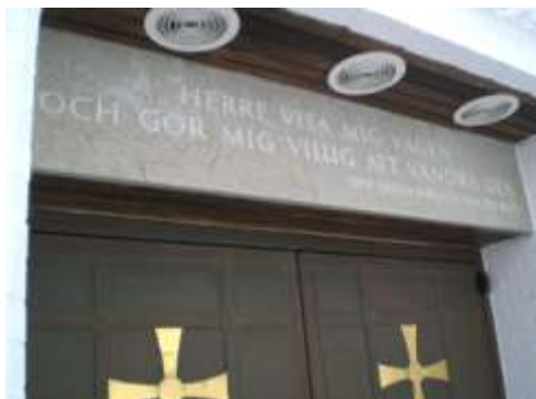
Den hl. Birgittas bøn over Birgittakirkens dør