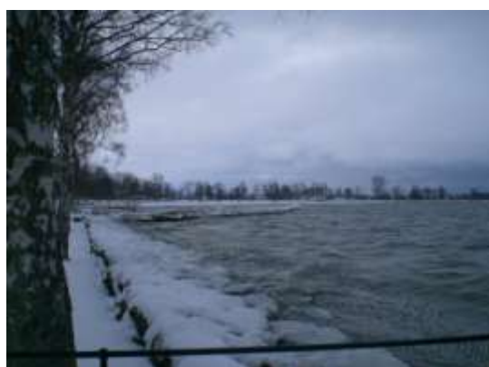
Så koldt og så smukt