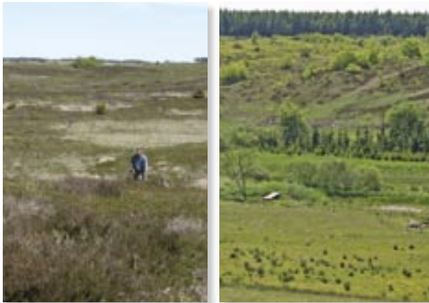
Heden med de mange klitdannelser

De himmerlandske Heder er resterne af et kæmpestort hedeområde, der indtil 1800-tallet dækkede store dele af Vesthimmerland fra Limfjorden til Rold Skov. Opdyrkning og tilplantning af de titusinder af hektar hede, der fandtes engang, betyder at der nu reelt kun er omkring 900 ha tilbage. De himmerlandske Heder er i modsætning til hederne i Vestjylland ret kuperede, idet de ligger på morænebakker, dækket af flyvesand. 4 store bakkedrag præger området, længst mod vest Vindblæs Hede og øst herfor Oudrup Østerhede, Lundby - Ajstrup Hede og Kyødale. Den uregulerede Bruså løber i en smal, frodig dal gennem hederne.