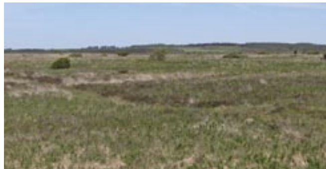
De gamle vejspor træder frem som parallelle fordybninger i landskabet

De himmerlandske Heder gennemkrydses af talrige gamle vejspor og hulveje, der vidner om livlig færdsel i området. På Lundby Hede gemmer lyngen op mod hundrede gamle vejspor i et kilometerbredt bælte på begge sider af den nuværende asfaltvej mellem Lundby og Borup. De er spor efter den gamle hærvejsforbindelse fra Viborg til Aggersborg og er en af de største samlinger af fortidige vejspor i Jylland. Vinkelret på disse spor ligger resterne af den gamle Aalborg-Løgstør landevej, anlagt i 1700-tallet af enevældens ingeniører, hvis livsfilosofi ses tydelig – forløbet er snorlige, natur og landskab underkaster sig den enevældige konge.