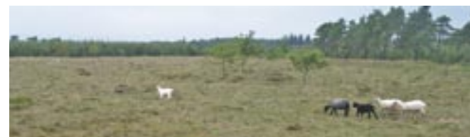
Flere steder sørger får og kreaturer for den vedligeholdende pleje af heden

For et par år siden blev den eksisterende fredning af De himmerlandske Heder fra 1938 udvidet med 400 ha, så der nu er fredet 1284 ha. Udvidelsen har skabt bedre adgangsmuligheder og stier, sikret naturpleje og åbnet for at genskabe noget af den tidligere hede. Skov bliver fældet og marker omdannes til hede efter en udpining med afgøder uden gødskning. Det er især vest for Oudrup Østerhede at forandringerne sker, og målet er et 11 km langt ubrudt bælte af hede.